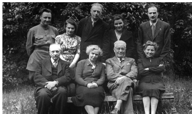
Кафедра інфекційних хвороб, 1946 р

У 1939 році на базі медичного факультету Львівського університету було організовано Львівський медичний інститут і ін-