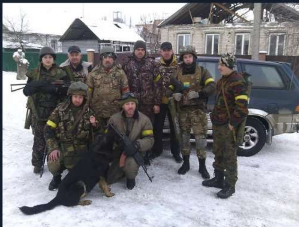
2-га штурмова рота 5-го батальйону ДУК ПС. Селище П'іски. Січень 2015-го.